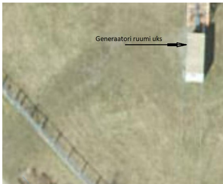
Joonis 1. Generaatori planeeritav asukoht - Maa-amet