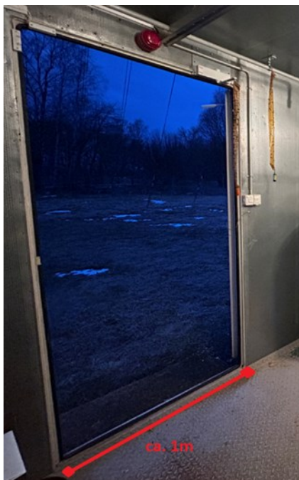
Joonis 3. Tõruvere generaatori konteiner – ukse mõõt -laius ca 1m.